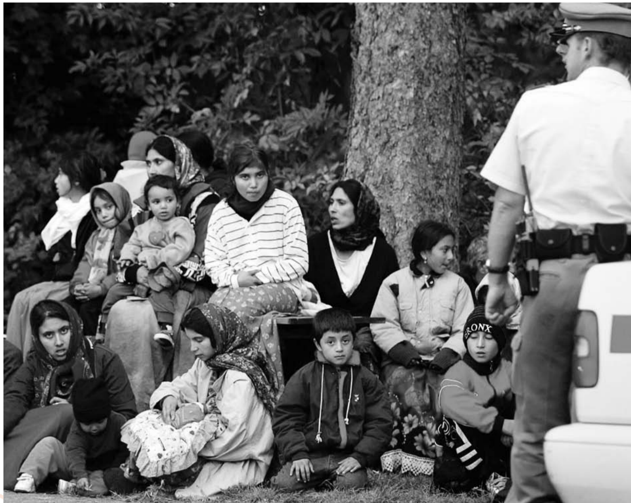
Auch im Kanton Waadt werden bereits illegal eingereiste Roma-Sippen aufgegriffen. Wenn die Personenfreizügigkeit Tatsache wird, dürften Rückführungen fast unmöglich werden.

Antwort: Niemand in Rumänien weiss genau, wieviele Roma dort leben. Man geht aus von zwei bis drei Millionen. Aber auch höhere Zahlen zirkulieren. Weil die Roma immer als grosse Sippen, in grossen Clans auftreten, fühlen sich andere Rumänen deutlich bedroht. Auch deshalb, weil die Roma kaum Integrationsbereitschaft zeigten. Sie leben ihr eigenes Leben mit eigenen Gesetzen und einer eigenen «Rechtsordnung», die auf für Nicht-Roma nicht nachvollziehbaren Eigentumsbegriffen basiert. In Gegenden mit zahl-