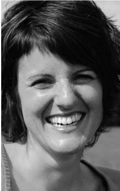
Geboren 1978, wohnhaft in Eichberg SG. Seit 2003 Mitglied des Nationalrats, SVP. Unternehmerin im Baumaschinen-Handel.

Die Wohlstandsunterschiede zwischen den beiden neuen EU-Ländern Rumänien und Bulgarien einerseits, der Schweiz andererseits sind riesig. Der gesetzliche Monats-Mindestlohn für einen Vollzeitjob beträgt in Rumänien