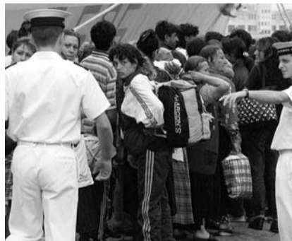
Alltag in Italien: Illegal vom Balkan eingereiste Roma beim Registrierungsversuch.

Antwort: Wenn Grenzkontrollen wegfallen, zieht es auch Roma dorthin, wo die besten Lebensumstände, die besten «Verdienstmöglichkeiten» nach Roma-Bräuchen locken. Also nach Westeuropa. Vor allem Italien und Spanien haben eine massive Roma-Zuwanderung erlebt und sind jetzt mit